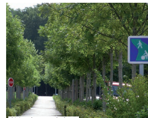
Liaison douce, rue des Lacs

La ville du Mée-sur-Seine est sillonnée de plusieurs pistes cyclables, dont l'artère principale permet de traverser le territoire communal pratiquement sur toute sa longueur. Plusieurs réseaux secondaires existent déjà, et une nouvelle piste, longeant le bord de Seine, sera réalisée par la Communauté d'Agglomération Melun Val-de-Seine avant la fin de l'année 2018. Ces diverses voies sont fréquentées à la fois par les marcheurs et les cyclistes. Le territoire communal étant assez peu étendu, et majoritairement plat dans sa partie où la population est la plus dense, il est envisagé d'augmenter la part des voies permettant au vélo de prendre une place plus importante dans les déplacements quotidiens.