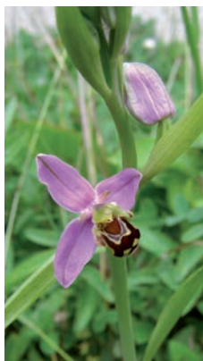
Ophrys, square Perrault

Chaque année, les membres de l'association marquent les emplacements à préserver des tontes, posent des panneaux explicatifs, et organisent des promenades avec le grand public ou les écoles, lors de la floraison des orchidées.