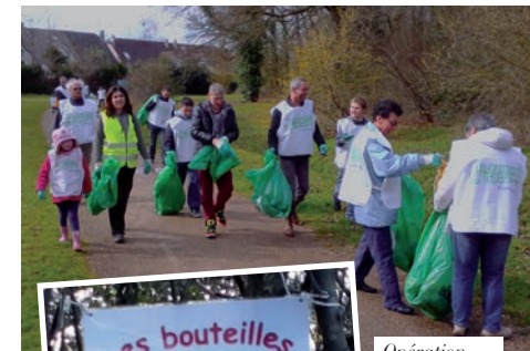
Opération « Nettoyons la nature »