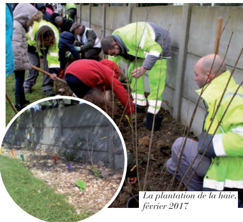
La plantation de la haie, février 2017

Avec l'aide du Service des Espaces Verts de la Ville, chaque élève – ainsi que chaque enseignante – a planté un arbuste auquel il a donné son prénom, en plus de rappeler son essence. Cette première réalisation a vocation à entraîner d'autres, dans d'autres écoles de la Ville, en contribuant à renforcer la trame verte du Mée-sur-Seine.