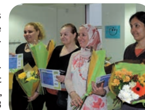
Remise des prix « Défi Énergie », 2017

Au niveau communal, 21 familles ont participé au défi, soit un total de 68 personnes.