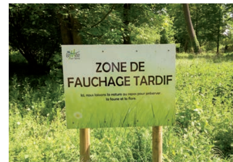
Le Mée-sur-Seine Guide de l'éco-citoyen • 9

De plus, la création de ces parcelles réduit les surfaces de tonte régulières traitées en Mulching, ce qui minimise les évacuations des déchets et les déplacements.