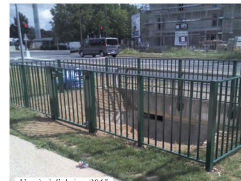
L'accès à l'abri en 2015