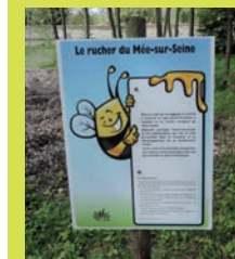
Rucher du Mée-sur-Seine

Afin de protéger l'environnement et les pollinisateurs – qui ont un rôle primordial dans le maintien et le développement de la biodiversité locale – la Ville a souhaité qu'un apiculteur-récoltant installe un rucher composé de 5 ruches dans le Parc Chapu, en mars 2018.