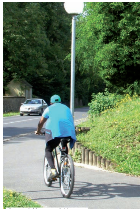
Piste cyclable, avenue J. Monnet

La ville du Mée-sur-Seine est sillonnée de plusieurs pistes cyclables, dont l'artère principale permet de traverser le territoire communal pratiquement sur toute sa longueur. Plusieurs réseaux secondaires existent déjà, et une nouvelle piste, longeant le bord de Seine, sera réalisée par la Communauté d'Agglomération Melun Val-de-Seine avant la fin de l'année 2018. Ces diverses voies sont fréquentées à la fois par les marcheurs et les cyclistes. Le territoire communal étant assez peu étendu, et majoritairement plat dans sa partie où la population est la plus dense, il est envisagé d'augmenter la part des voies permettant au vélo de prendre une place plus importante dans les déplacements quotidiens.