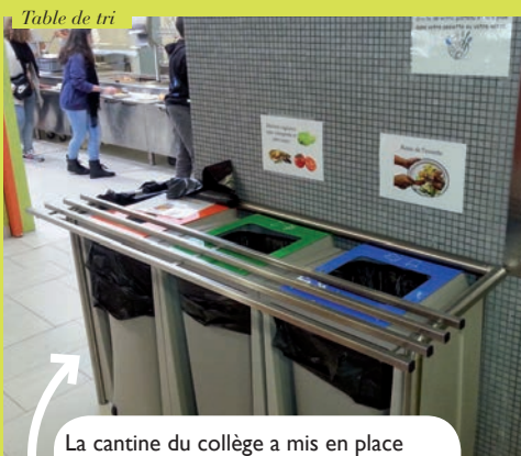
Table de tri

Fort de son engagement en faveur du développement durable, le Collège Elsa Triolet a mis en place plusieurs actions pour sensibiliser les enfants – futurs citoyens – au respect de l'environnement.