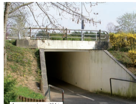
Le souterrain en 2014

un regard. La Ville a obtenu de ne fermer que partiellement un des accès, par un mur muni d'une ouverture haute. Celle-ci permettra potentiellement à des chiroptères de s'y réfugier en hiver, en nichant dans des piliers de briques creuses construits à l'intérieur du souterrain. Des naturalistes vérifient après chaque hiver si des chauves-souris ont repéré et adopté cet abri.