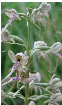
Orchis bouc, talus de la « Ferme »