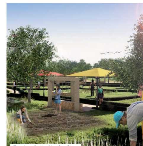
Esquisse des jardins familiaux

Si vous êtes intéressé(e)s par ce projet, vous pouvez contacter la Mairie au 01 64 87 55 00.